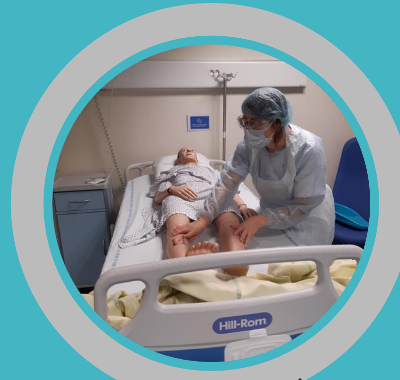
Simulation en santé (avec mannequin haute fidélité ou acteur)