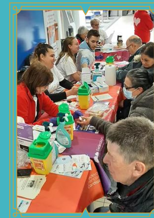
Ateliers de santé publique, de bien-être, de créativité