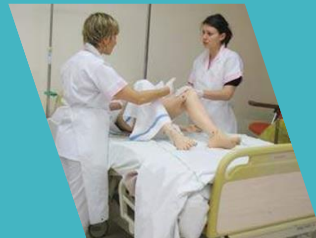
TD en collaboration AS/IDE