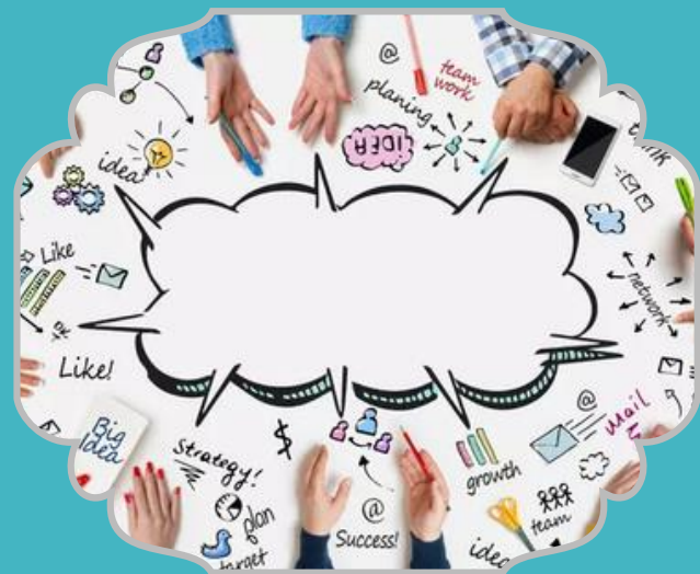
Analyse de Pratique Professionnelle